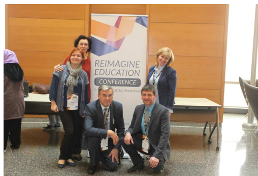
2015 Reimagine Education, Филадельфия, США