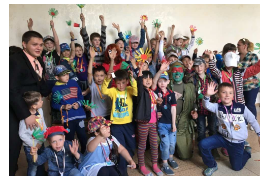
2016 Центр Интерактивного обучения