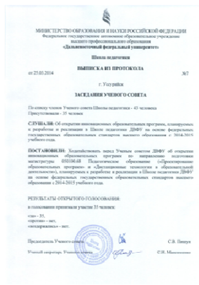
2014 Открытие ОП «Дистанционные технологии в образовательной деятельности»